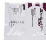
Экспресс-тест на выявление гепатита С по слюне